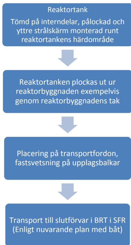
Figur 1.1: Avfallens ursprung och hantering

Reaktortankarna slutförvaras i Bergssal för ReaktorTankar (BRT).