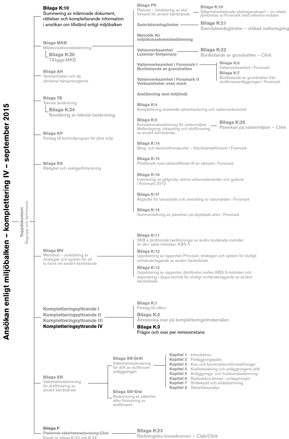
Figur 1-1. Samtliga dokument inlämnade i ursprunglig ansökan samt i kompletteringarna I, KP, II, III och IV. Grå text anger dokument inlämnade med ursprunglig ansökan samt i komplettering I, KP, II och III. Svart text anger dokument som uppdaterats eller tillkommit i samband med inlämnade av komplettering IV.

Summering av inlämnade dokument, rättelser och kompletterande information i ansökan om tillstånd enligt miljöbalken - hantering och slutförvaring av använt kärnbränsle