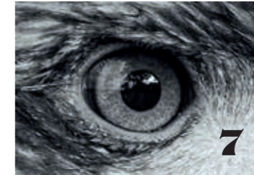
Det går bra för fåglarna. Senaste räkningen gav glädjande besked. 7