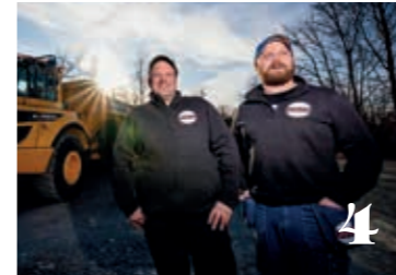
Växer så det knakar. Entreprenadföretag tror på skogen. 4

Fiberna i detta papper stödjer hållbart brukade skogar och tryckningen har skett i en miljöcertifierad process enligt ISO 14001.