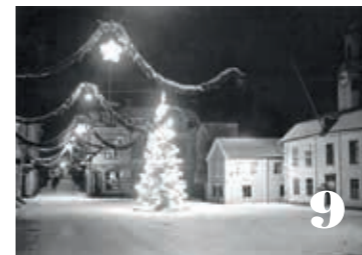
Julefrid. En bild säger mer än tusen ord. 9