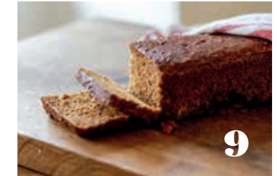
Bröd för amatörer. Tips om julbak som även den ovane bagaren kan lyckas med. 9