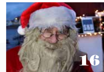
Dags för vårt julkryss. Tankenötter till julglöggen. 16