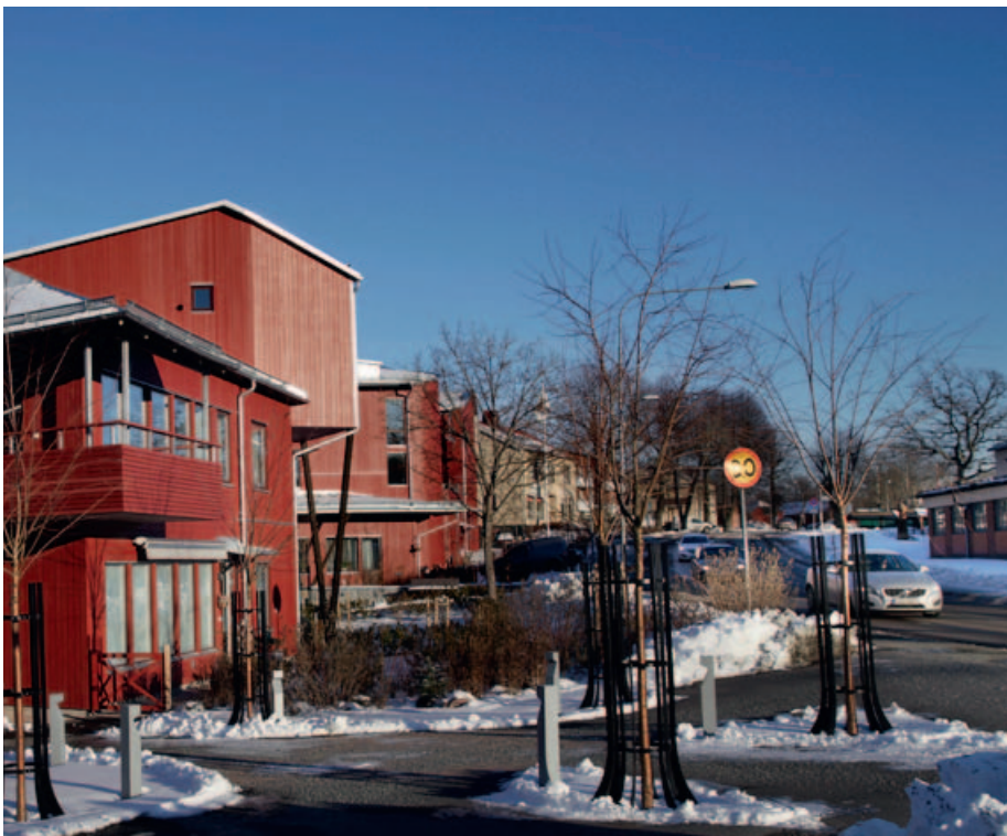
Kvarteret Mästersmeden i Österbybruk är ett av Östhammarshems nya bostadsområden.

TEXT Anne Adre-Isaksson