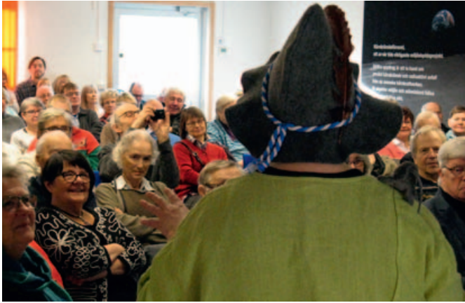
Folkligt när Snusmumriken kom på besök på SKB.