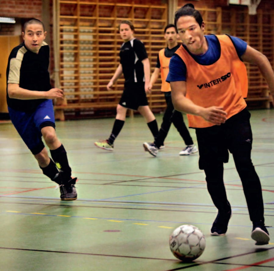
Livets vardagliga bekymmer försvinner för en stund. När det är fotbollsträning ligger allt fokus på spelet.