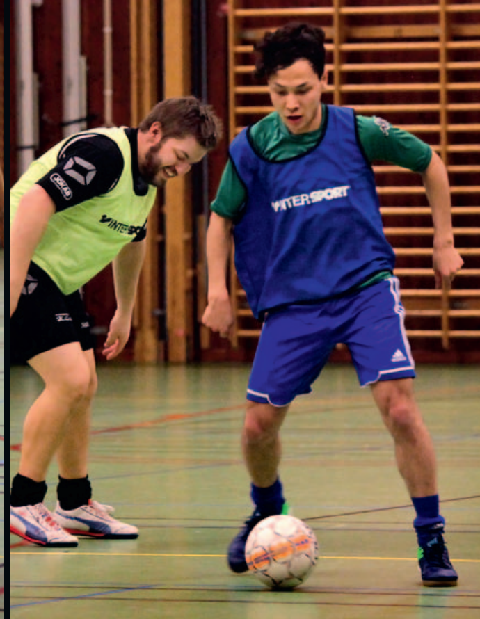
Kämpaglöd och glada skratt utmärker den här kvällen när Harg-Östhammar FF tränar i Frösäkershallen i Östhammar.